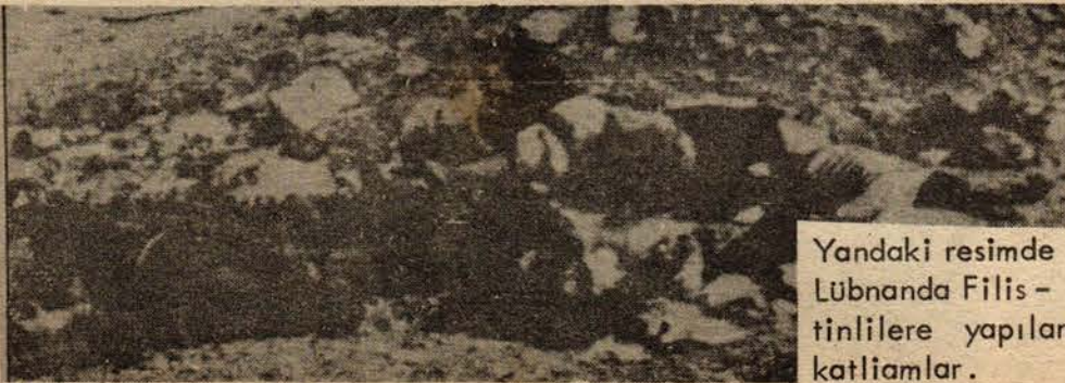
Yandaki resimde Lübnanda Filistinlilere yapılan katliamlar.

«Marksist - Leninist partilerimiz, Marksizm - Leninizm ve proleter enternasyonalizmi temelindeki kopmaz dostluğumuzu daha da güçlendirmek ve çelikleştirmek için her zaman çarpışmış ve çalışmıştır. Bu, bundan sonra da böyle devam edecektir.»